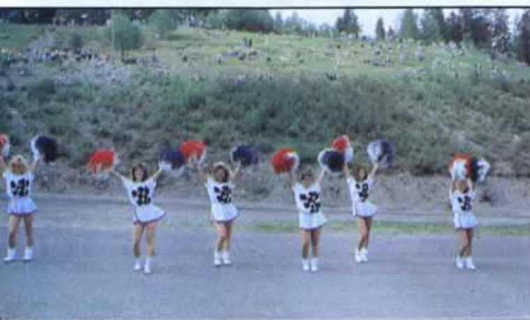
Komeiden autojen lisäksi paikalla oli kauniita tyttöjä, jotka oli lainattu tilaisuuteen jenkkitutusen huutosakista. Lisää tällaista! (MM)