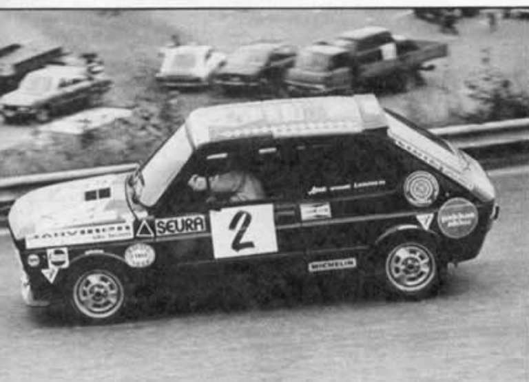
◆ "Ratin" tyylinäyte. Turvavyön kireydestä on ollut paljon puhetta, mutta sekös jämsäläistä häiritseisi. Taas kerran kultainen SM-mitali.