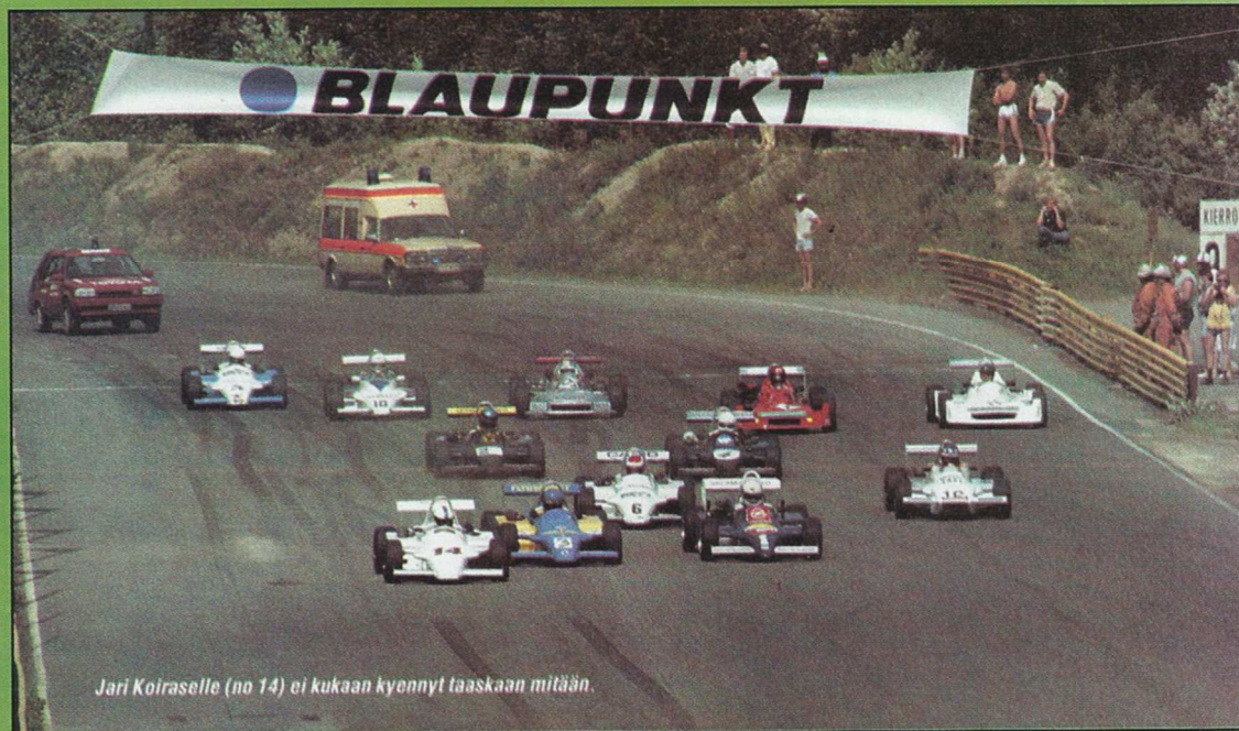
Jari Koiraselle (no 14) ei kukaan kyennyt taaskaan mitään.